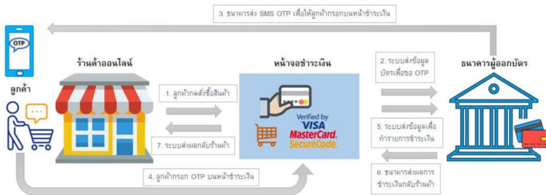
รูปที่ 2 แสดงขั้นตอนการทำงานของเทคโนโลยี 3D Secure